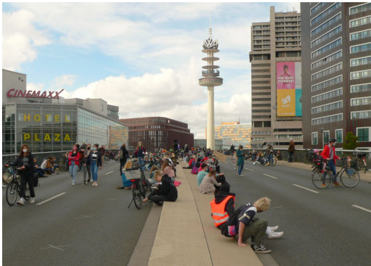
Klimastreik auf der Hochstraße an Hannovers Raschplatz.